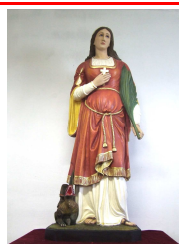
S. Margherita, vergine e martire FESTA PATRONALE A BEVERATE

8 LUGLIO DOMENICA VI DOMENICA DOPO PENTECOSTE Anno B Lettura Es 3, 1-15 Salmo Sal 68 (67), 5. 8-9. 11. 27. 32-34 Epistola 1Cor 2, 1-7 Vangelo: Mt 11, 27-30